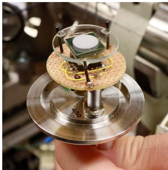
3. ábra. Perovszkit vékonyréteg fotoelektron-sokszorozóval egybeépített detektor prototípusa.

Az Atommagkutató Intézet több évtizedes vákuumtechnikai, kriofizikai, elektronikai tervezési és kutatási tapasztalat birtokában nem csak alapkutatási tevékenységet végez, de sikerült a kísérleti kutatások és műszerfejlesztések során szerzett gyakorlatot ipari problémák megoldására is hasznosítani. A VákuumTömörség és MérésTechnika (VTMT) Kft. 2006-ban történő megalapításával létrehozott spin-off társasággal ipari körülmények között felmerülő szivárgásellenőrzési problémák megoldását tűzte ki célul és jelenleg is sikeresen működve