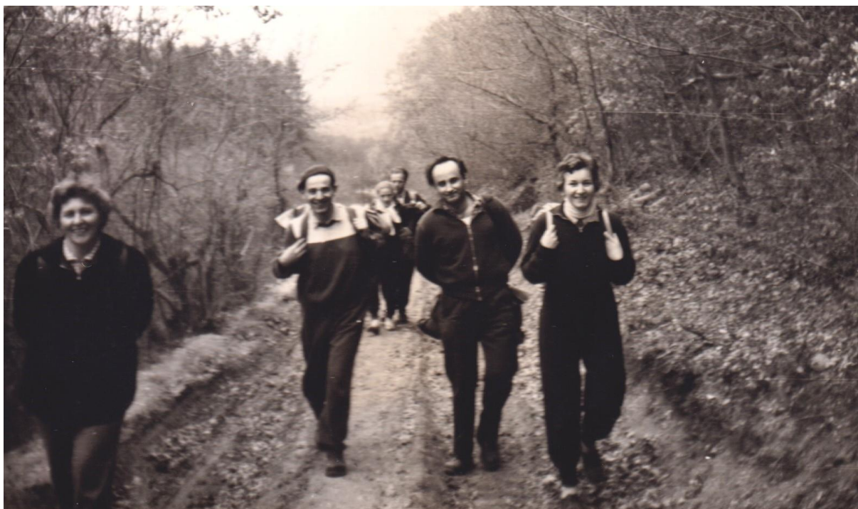
27. De talán eltévedtünk? És egyesek – úgy látszik – már el is fáradtak!