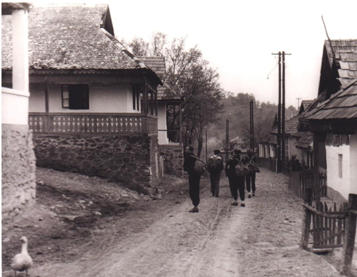
29. 1963. De itt van Debrecenben a Nagyerdő, ezt is fel kell fedezni!