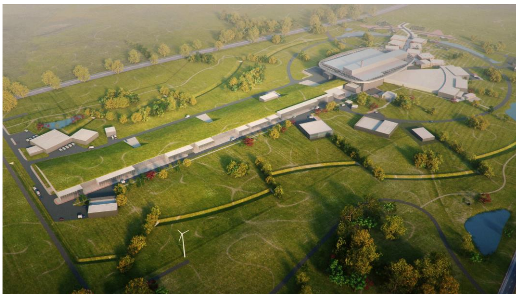
A Lundban épülő Európai Spallációs Neutronforrás látványterve

A tervek szerint a berendezés költségének mintegy 35%-át a finanszírozó országok high-tech berendezések beszállításával fedik le, erősítve ezzel a hazai K+F szektort. A 35%-os átlagos értékkel szemben Magyarország 70%-os arányban fog berendezéseket beszállítani, mégpedig az MTA kutatóintézetek technológiai fejlesztései révén. Az MTA három érintett kutatóintézete (Atommagkutató Intézet, Energiatudományi Kutatóközpont, Wigner Kutatóközpont) a 2015-ös tárgyalások eredményeképpen többféle nagyértékű berendezés kifejlesztésére kapott felkérést és az elsők között került elfogadásra egy 2,2M euró értékű magyar technológiai beszállítás. A kutatóintézetek szakmai tapasztalatának széles spektrumát mutatja, hogy a magyar hozzájárulás egyaránt érinti az ESS részecskegyorsítójának biztonsági, mérésvezérlő rendszereit és kísérletek során használt detektorrendszereket is.